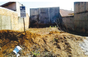
GROOT TERRENO COM 300 METROS. OPORTUNIDADE DE NEGOCIO. CONSULTE-NOS