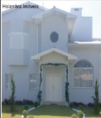
COND PALM PARK , Sobrado c/ 04 suites, sala de jantar, cozinha c/ AE, sala de estar, escritório, e quintal grande. AC-226m 2 AT-1000m 2 (CA00176).