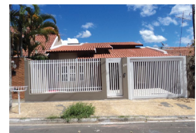
GROOT , Casa c/ 03 dorm, sendo 01 suite, sala, coz c/ AE, sala de jantar, area coberta c/ banheiro no fundo, gar., p/ 02 carros cobertos. AC-145m 2 AT-250m 2 (CA00087).

CENTRO , AP novos com ótima localização de 02 dormi., sala, coz. com AE e banheiro. (AP00015).