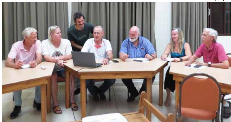
Reunião da comissão organizadora