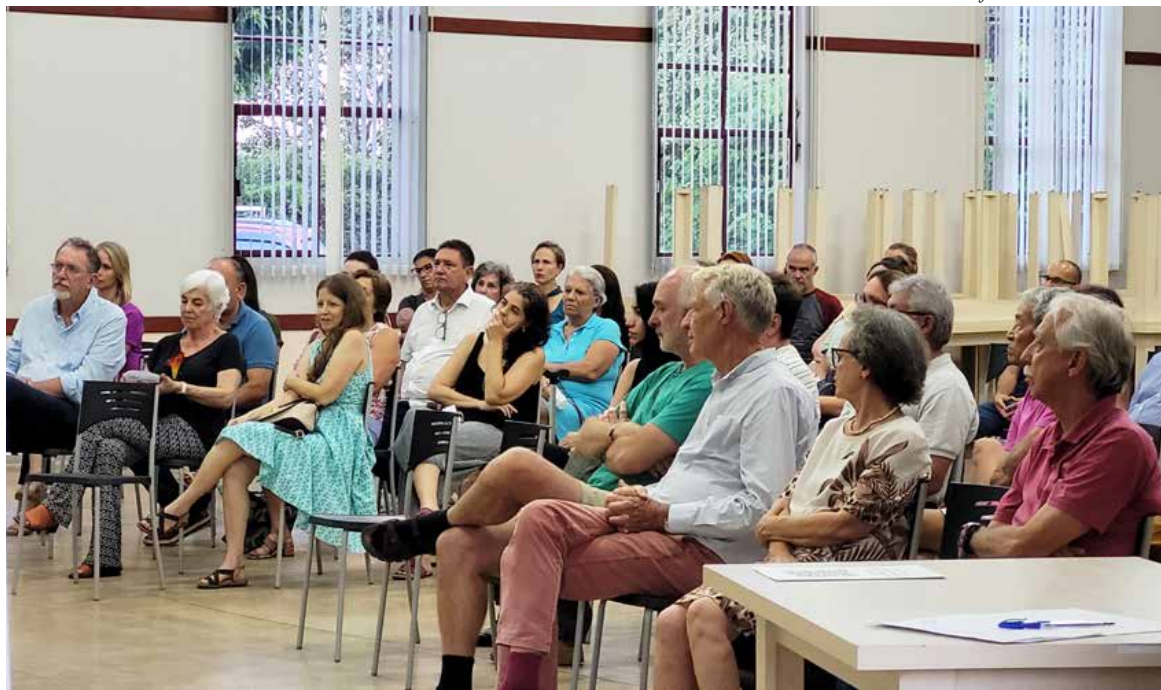
Integrantes do Conviva e convidados assistem apresentação das propostas