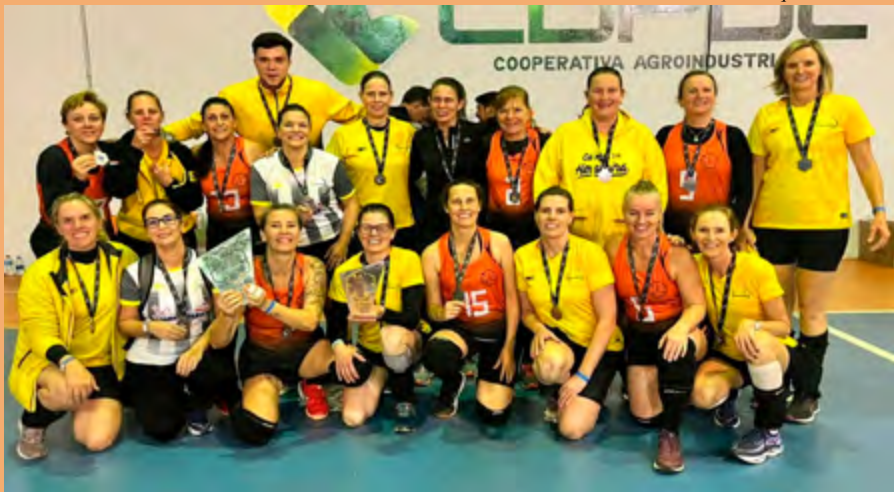
Clube Fazenda Ribeirão