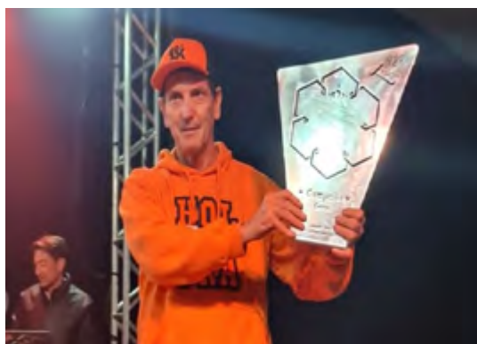
Holambra recebe troféu de campeão geral.