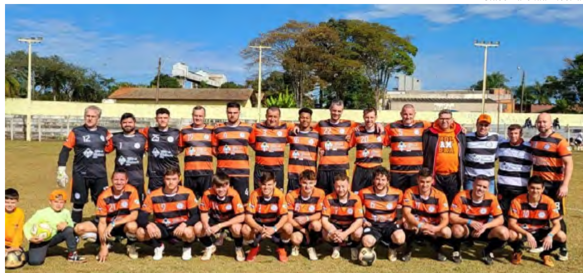
Futebol de campo.