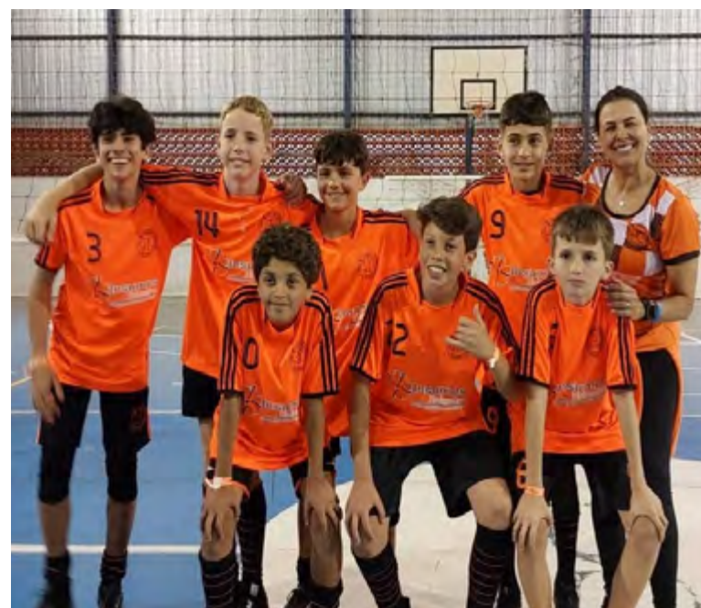
Vôlei masculino infantil.