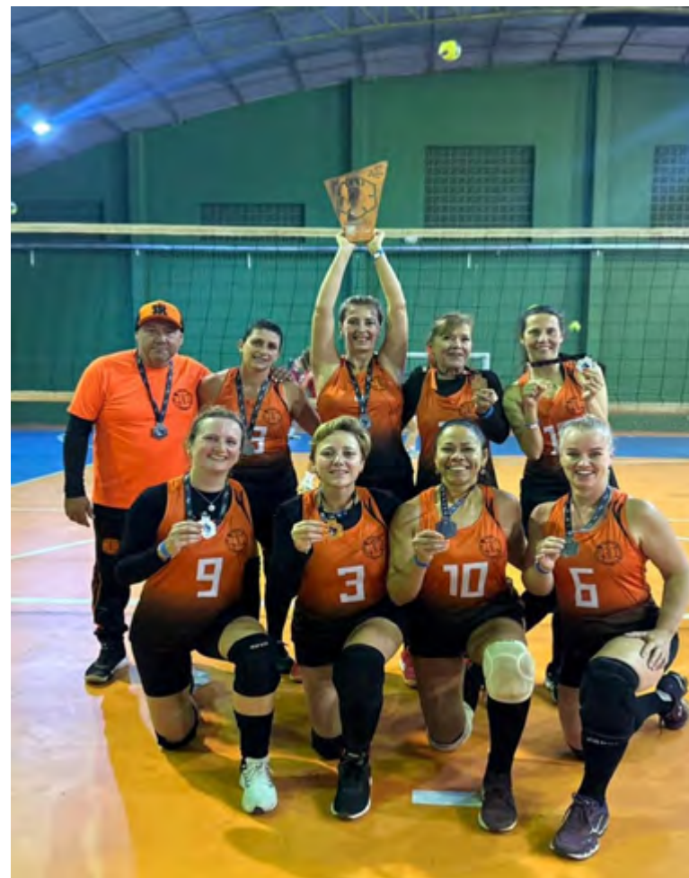
Vôlei feminino veteranas.