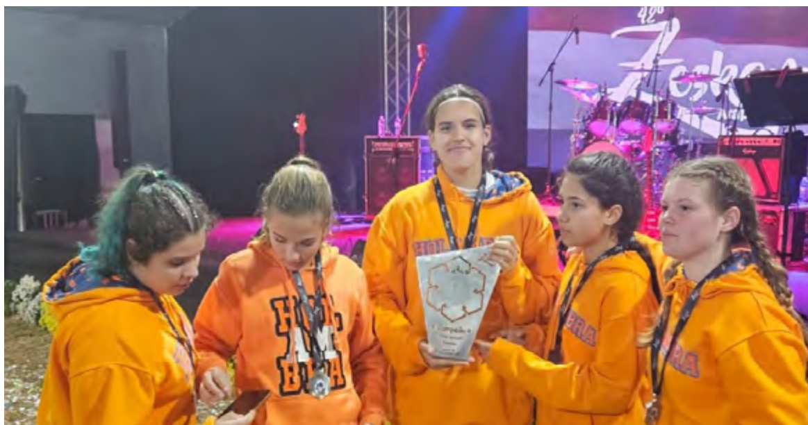
Futsal infantil feminino.