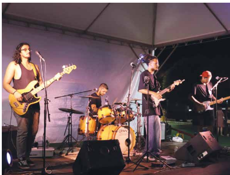
Banda de La Calle: apresentação neste domingo

31 de outubro, têm direito a uma entrada gratuita por dia. Menores de 15 anos só terão acesso ao local acompanhados dos pais ou responsáveis.