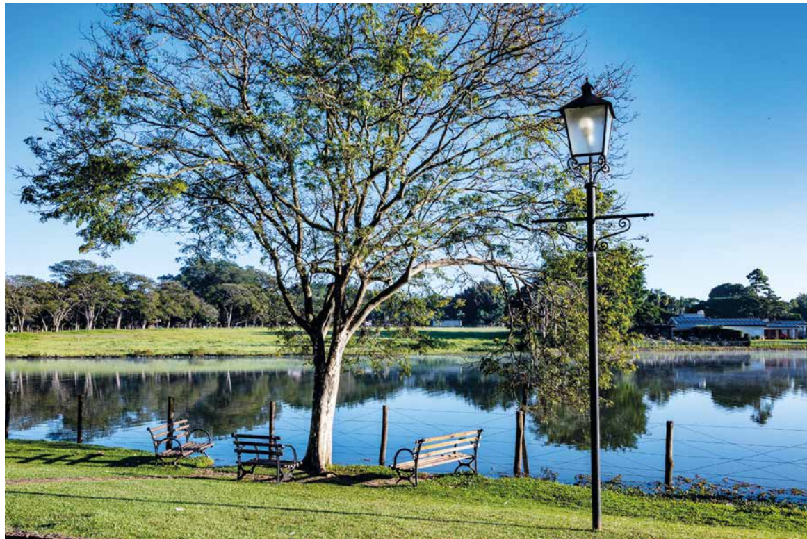
Holambra: população pode ajudar a manter a qualidade de vida que a faz tão especial

A “carta para o futuro”, que pretende ser entregue aos postulantes aos cargos legislativos e executivo de Holambra no ao que vem, entra na fase de divulgação ampla e de