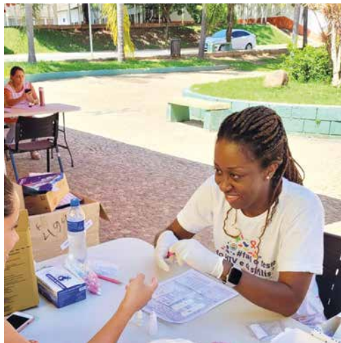
Profissional da saúde orienta moradores