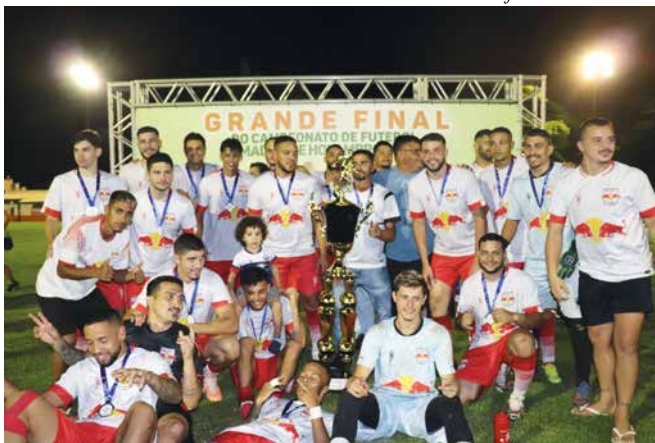
Tamo Junto recebe troféu de vice-campeão