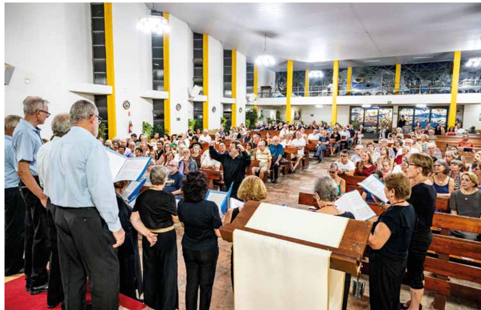
Público prestigia Concerto de Natal na Igreja Matriz