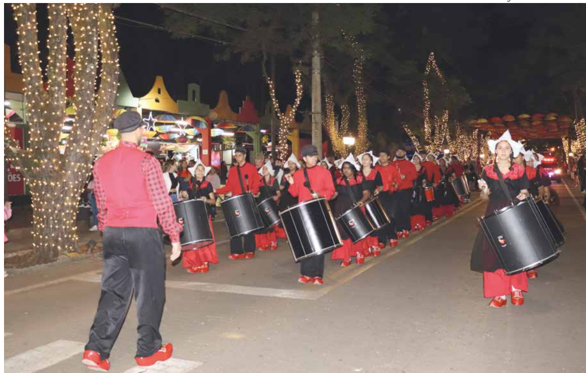
Fanfarra Amigos de Holambra: apresentação na parada encanta moradores e turistas

O portal principal conta com uma árvore de Natal de 15 metros de altura e, a Torre do Relógio, na Avenida das Dálias, tem iluminação especial. A decoração da cidade possui ainda mais de 100 quilômetros de cordões de LED e 4 mil unidades de cascatas de luz instalados em troncos e galhos de árvores da região central.