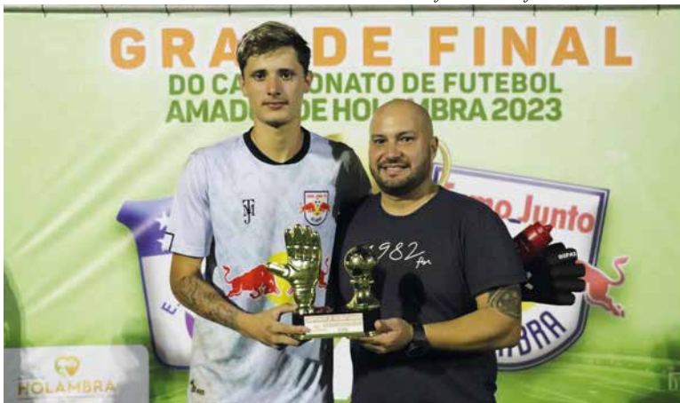
Melhor goleiro, do Tamo Junto, recebe premiação