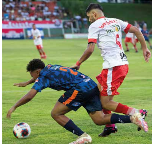
Mais um lance do jogo