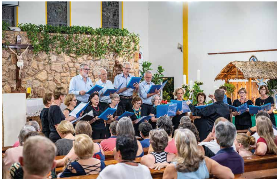
Coral Harmonia, antigo "Grupo Holambra Jovem"