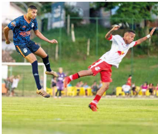
Disputa acirrada no tempo normal