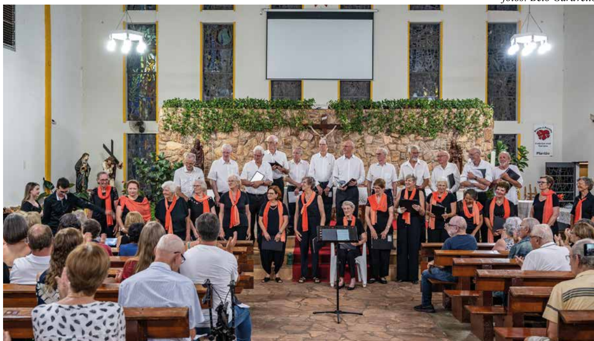
Coral Pró-Música, organizador do evento: formado em 1986