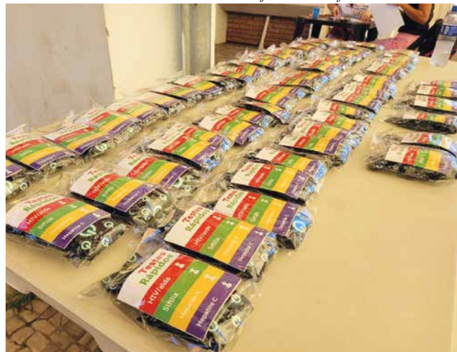
Testes: disponíveis ao longo do ano