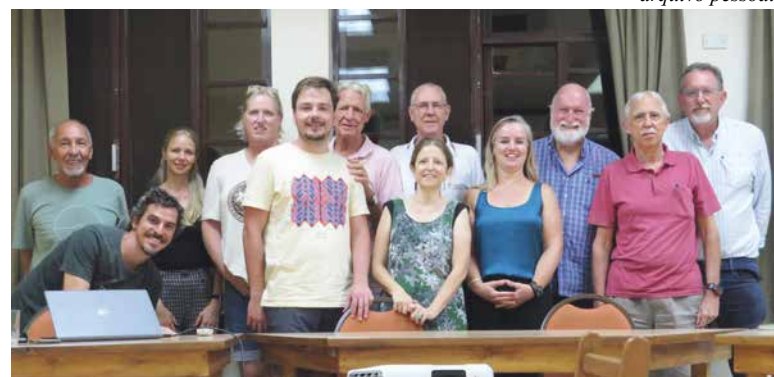
Conviva: pensar o futuro do município

trabalho não está concluído: “A continuidade é justamente abrir para sugestões, discussões, serão reuniões para aperfeiçoamento das propostas”, explica.