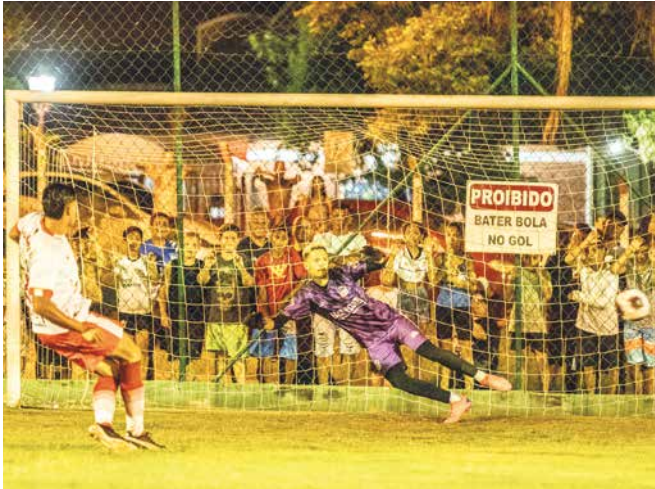
Disputa nos pênaltis: gol do Tamo Junto