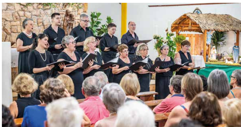
Coral Madrigal Cantabilis, de Jundiá

A Igreja Matriz de Holambra sediou no último sábado, dia 2, um evento que já faz parte do calendário de atividades realizadas no fim do ano na cidade. Músicas sacras, folclóricas e internacionais encantaram o público presente ao 23º Encontro de Corais. Promovido pelo Coral Pró-Música, o evento teve a participação dos corais Harmonia, de Holambra, e Madrigal Cantabilis, de Jundiá.