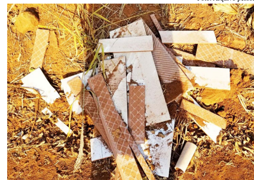
Lixo recolhido na estrada do Fundão: desrespeito aos moradores, ao turista e ao meio ambiente