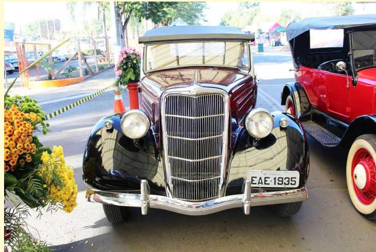
Um dos destaques da Mostra foi o Ford Modelo Phaeton, ano 1935

Outro destaque foi a praça de alimentação que, este ano, além dos quiosques fixou ganhou reforço de Food Trucks e agradou o público. Assim, a única preocupação do Old Car Society é garantir, para o próximo ano, o mesmo atendimento ao público e aos expositores, sabendo que, com tamanho crescimento de uma edição para a outra, a Rua da Amizade está ficando pequena para tanto sucesso!