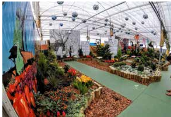
Experiências em Holambra que integram a plataforma

A escolha do Circuito das Águas se deve pelas ligações afetivas e proximidade da atuação dos criadores da ferramenta, permitindo que eles acompanhem in loco as dificuldades das cidades da região. A plataforma, segundo os especialistas em turismo, responde a diversas questões. Os turistas ficam sabendo, por