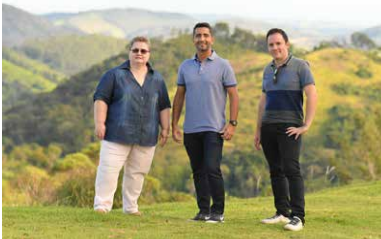
Criadores da VZIT, uma startup de turismo (travel tech)

A mesma pesquisa aponta que roteiros que oferecem turismo gastronômico, serviços exclusivos de bem-estar, aluguel de suítes para microcelebrações ou de espaços inteiros, além de ofertas de experiências e passeios personalizados, estarão entre os mais procurados neste primeiro momento.